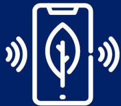
The Harper Adams Future Farm