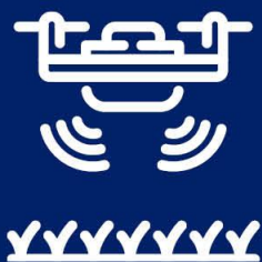
AgriTech Innovation hubs