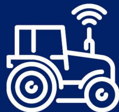
Farm Education Centre