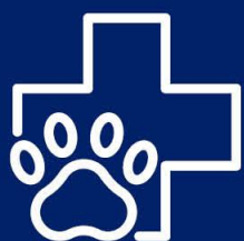
Veterinary Education Centres